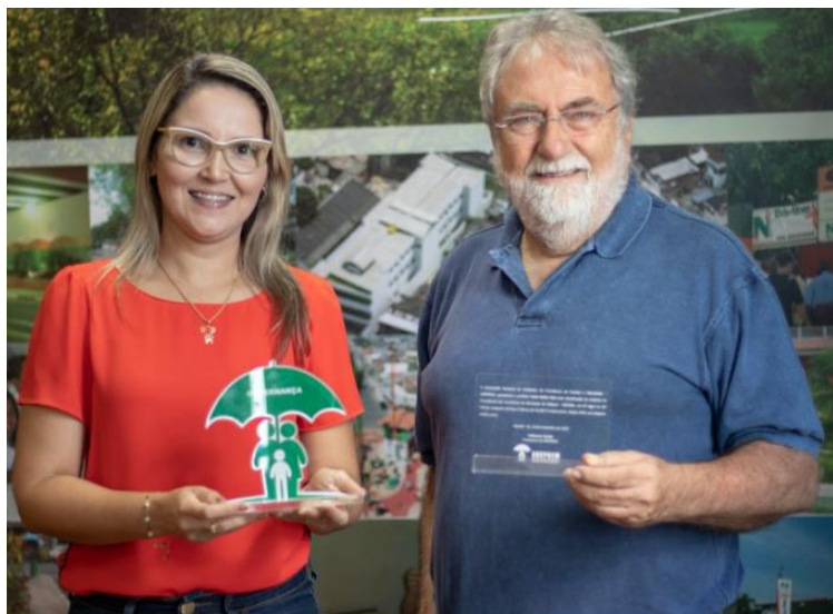
A Presidente Danielle Agero e o Prefeito Farid Abrão

Os princípios e parâmetros que regem e norteiam o PREVINIL são: a transparência, a responsabilidade corporativa e social, a ética, as iniciativas inovadoras como fatores preponderantes, além da humanização e harmonização no atendimento.